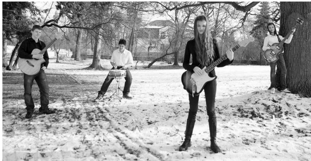
VÍTĚZ letošní Dětské porty je jablonecká kapela Nautica.

„Zahrajeme sedm věcí. Aranžmá jsme mírně rozšířili, ale myslím, že by nebyla dobrá cesta snažit se dodržet Krylovu úspornost. Když dva dělají totéž, není to vždy totéž.