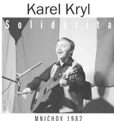
Karel Kryl Mnichov 1982